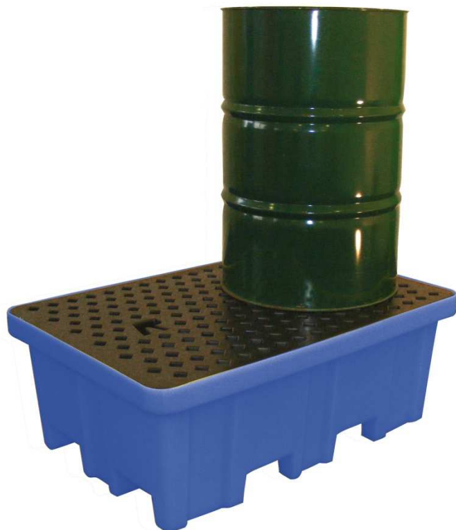
Bac avec double passage de fourches