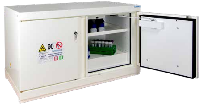
▲ 792+E + C2