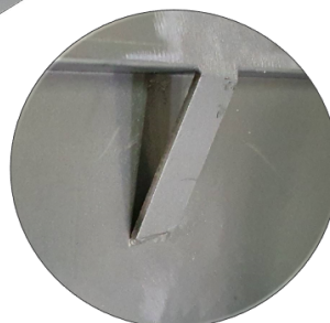
Anses de levage sur la largeur