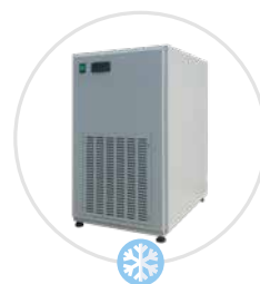
Système de réfrigération intérieur en option