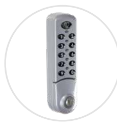
Option serrure à code SERCODE