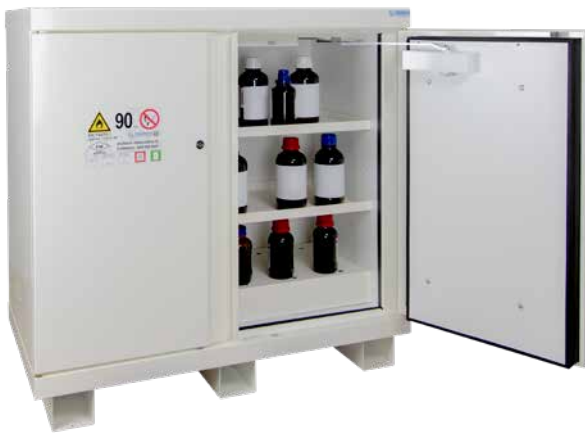
▲ 793+E + C35