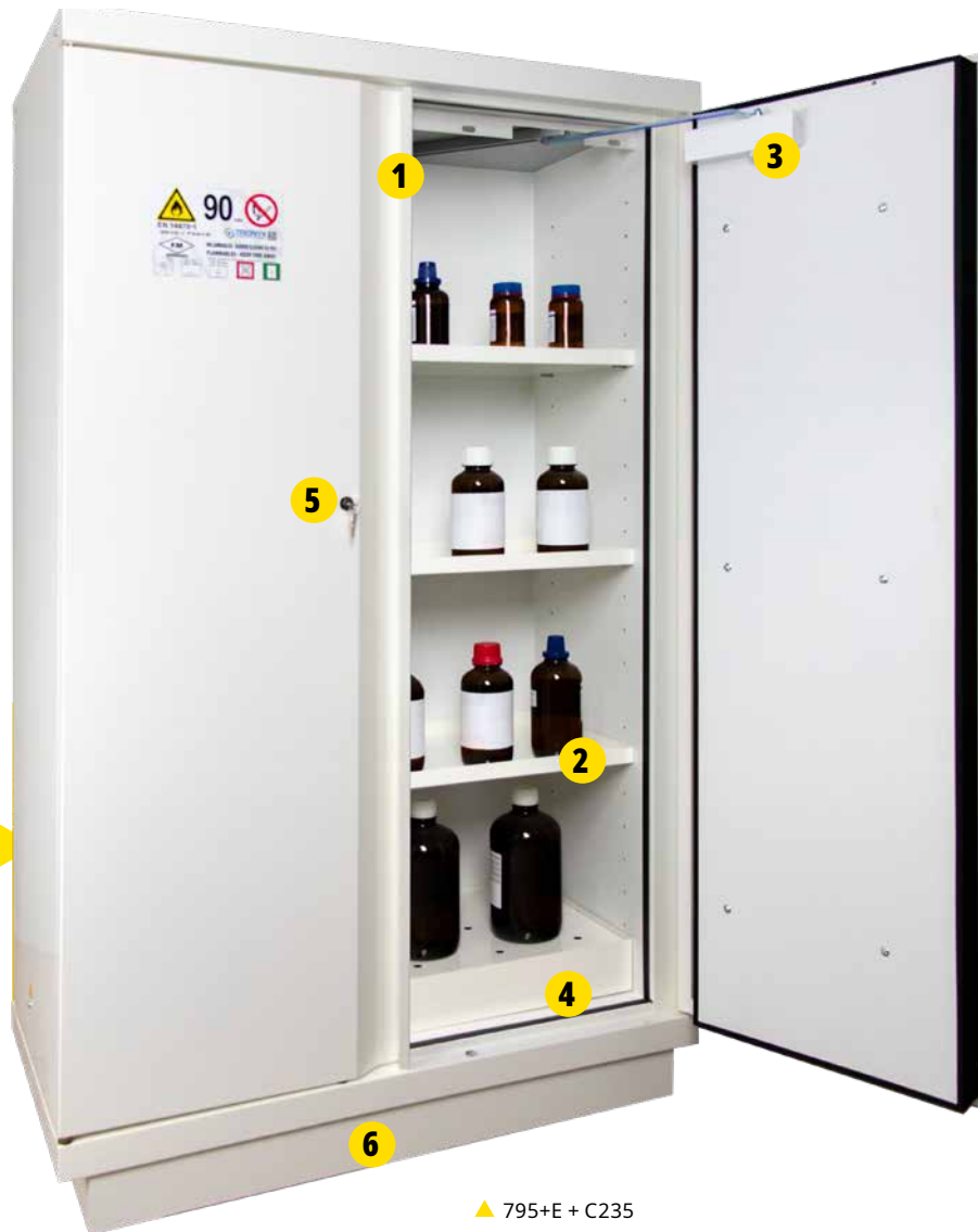
▲ 795+E + C235