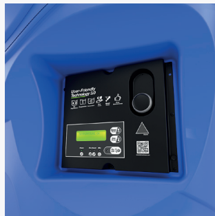
Boîtier électronique rétro-éclairé & interchangeable sans-outils