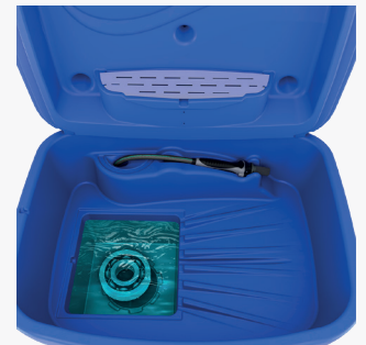
Zone de trempage