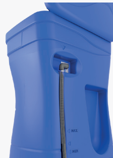
Système de vidange