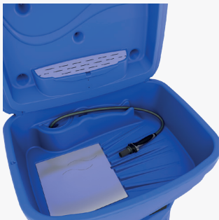
Table de nettoyage ergonomique